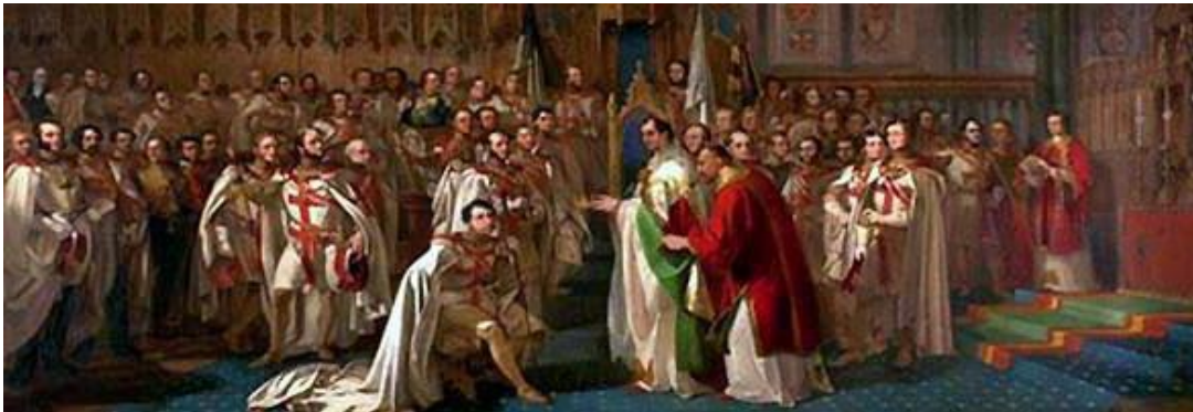
Fig. 3 Notre Dame de Paris, el Emperador Napoleón I, reforma la Orden del Templo.

Hoy el Movimiento Templario tiene un alma laica con ramificaciones en todo el mundo (con más de 500.000 caballeros a los que se añaden las familias de cada uno) que, a partir de la Reforma Napoleónica de 1804, con las Iglesias, pero no en las Iglesias, trata de vivir la espiritualidad de San Bernardo de Chiaravalle según las tradiciones cristianas específicas de pertenencia.