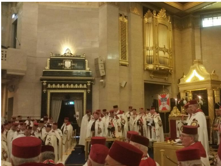
Fig.6 Gran Logia Unida de Inglaterra, asamblea anual de los Templarios Escoceses

(OSMTHU) no tiene contacto con las organizaciones masónicas de manera directa, ni tampoco organiza actividades conjuntas o viceversa, sin embargo no prohíbe que un Mason pueda ser un Caballero de la Orden del Templo, participa activamente en todas las actividades de las Iglesias y comunidades religiosas que a menudo albergan la sede de los Prioratos y Encomiendas de acuerdo con la tradición religiosa y respetando las creencias de cada uno.