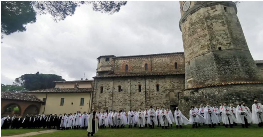
Fig. 4 Retiro Epiritual en Assisi, Abbazia di San Salvatore a Umbertide (Ottobre 2020), Templari Catolici de Italia.

llamados grupos "neotemplarios", indicando explícitamente que la Iglesia sólo reconoce la Orden Soberana Militar de Malta y la Orden Ecuestre del Santo Sepulcro de Jerusalén. Una invitación no siempre respetada, por la que fue necesario reiterar con la nota 755, firmada por mons. Luigi Moretti Vicedirector de la Vicaría de Roma, del 19 de mayo de 2009, la abstención en la capital "de cualquier acto de investidura u otras ceremonias similares para asegurar favores divinos a los participantes".